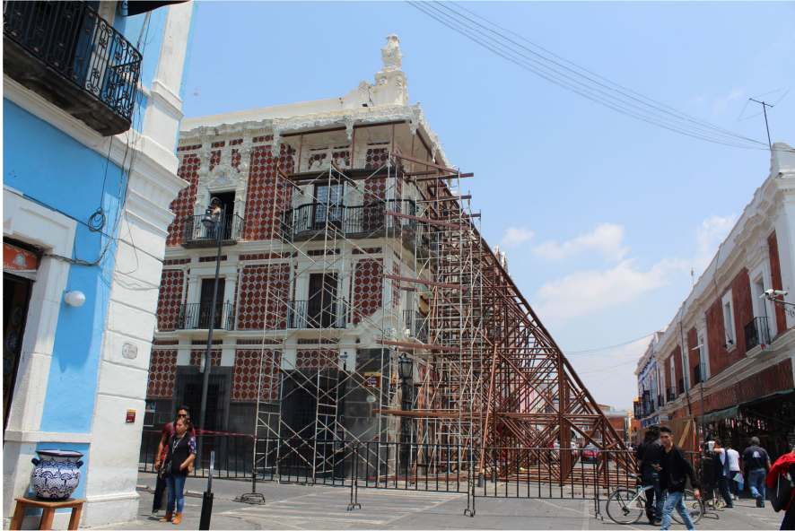
Fig. 6. Visión de la fachada exterior del Museo Casa Alfeñique apuntalada por los daños ocasionados en el terremoto de 2017. Puebla. México.