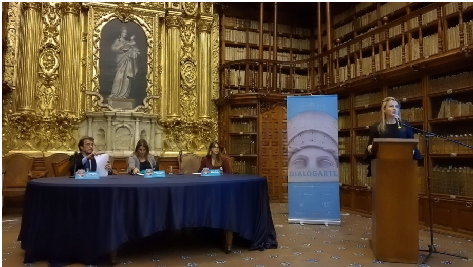
Fig. 8. Instantánea de la ponencia El oro y el Barroco en el ciclo de conferencias “Dialogarte. La Jiribilla del Barroco” organizadas por la Escuela Taller de Capacitación en Restauración de Puebla y la Secretaría de Cultura en octubre de 2018.

Y, para finalizar la lista de actividades llevadas a cabo por la Escuela Taller y sus participantes, es más que oportuno dedicar unas líneas para reflejar su implicación con la difusión de la cultura. En este sentido, la mencionada institución ha organizado jornadas y ciclos de conferencias como DIALOGARTE. Junto con las entidades universitarias de la localidad y la Secretaría de Cultura del Estado de Puebla, han desarrollado dos ediciones con un programa con especialistas internacionales para tratar temas como “el Barroco en el Arte Internacional” (2018) o cuestiones de gran interés como “el fenómeno de la Conquista y la Figura de Hernán Cortés” (2019) [Figura 8].