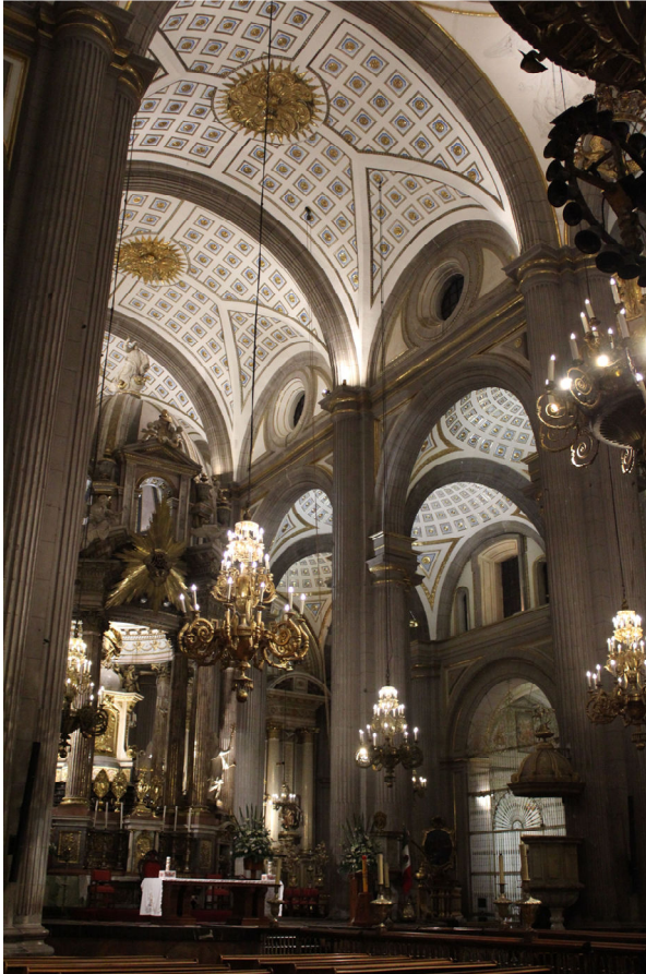
Fig. 7. Visión del ciprés y la nave central de interior de la Basilica Catedral de Puebla. México.

Asimismo, buscando dotar al ciudadano interesado por los bienes patrimoniales de herramientas con un enfoque más específico que los talleres generales, en 2018 apostaron por ofertar una formación complementaria en forma de cursos de extensión con una duración de entre uno a tres meses. Los talleres más representativos y con mejor acogida fueron el de Conservación preventiva y estabilización del patrimonio documental, seguido del de Elaboración de vitrales con técnica de Tiffany y emplomado 28 y del de Técnica de cartonería, así