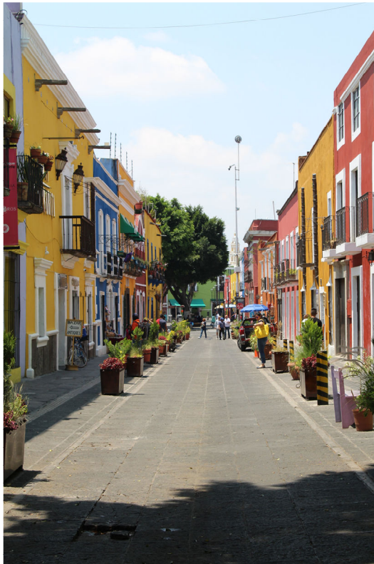
Fig. 1. Vista general de la calle 6 Sur o Callejón de los Sapos. Puebla. México.

Estos nombramientos, junto con la excepcionalidad del entramado de riqueza cultural existente en su Centro Histórico, han posibilitado que, desde el Gobierno del Estado, se plantee un discurso cultural específico cuya finalidad se ha localizado en acciones encaminadas a crear una mayor oferta de productos turísticos, como ha sido, entre otros espacios, el pintoresco e icónico Callejón de los Sapos [Figura 1]. Sin embargo, la peculiaridad y la singularidad de este patrimonio, su valor cultural y social y, especialmente, los desastres naturales acaecidos en 1999 y en 2017, han obligado a que las actividades de conservación y restauración sean una de las que mayor demanda han requerido en la gestión de la urbe. En este sentido, las acciones de la Escuela Taller de Capacitación en Restauración de Puebla (creada en 2001) han sido determinantes para la recuperación y mantenimiento de la ciudad.