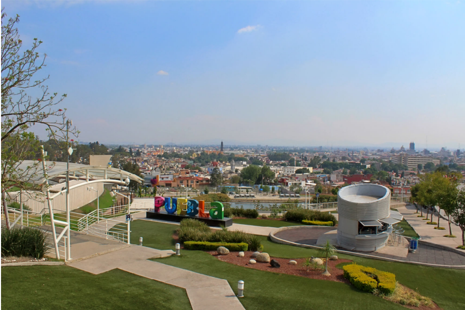
Fig. 2. Vista desde el Mirador de Mantarraya ubicado en la zona rehabilitada de los Fuertes y la Batalla del 5 de Mayo. Puebla. México.

amparada en las manifestaciones culturales, debe apostar por fórmulas estratégicas de planificación y gestión en la búsqueda de herramientas sostenibles.