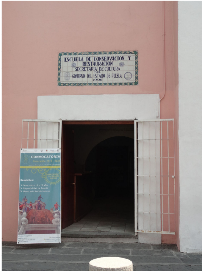
Fig. 4. Sede de la Escuela Taller de Capacitación en Restauración de Puebla. Av. 4. Oriente, 211. Puebla. México.

En los años siguientes, con la formación de la tercera y cuarta promoción (2007-2012) se continuaron con los proyectos anteriores, además de sumarse como mano de obra a las labores de conservación del Museo José Luis Bello y González [Figura 5]. Como se mencionó líneas arriba, permanecía cerrado por las afectaciones del terremoto de 1999 y, después de diez largos años y con la suma de fuerzas de la administración, se culminó su proceso de rehabilitación en 2010. Por otro lado, las conmemoraciones por el Bicentenario de la Independencia y el Centenario de la Revolución Mexicana hicieron de Puebla un lugar de referencia por su pasado histórico, llevándose a cabo, entre otros proyectos, la recuperación del Museo de la Revolución Mexicana y el espacio de la Casa de los Hermanos Serdán, donde la Secretaría de Cultura y el Gobierno