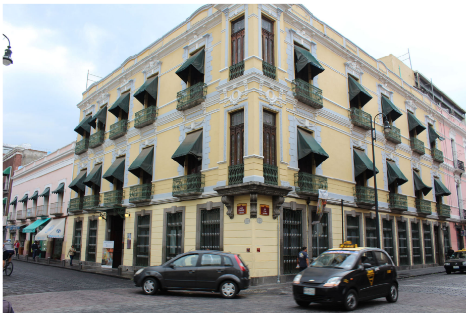
Fig. 5. Fachada del Museo José Luis Bello y González. Puebla. México.

del Estado de Puebla involucró a los jóvenes de la Escuela Taller en sus labores de mantenimiento y restauración 23 .