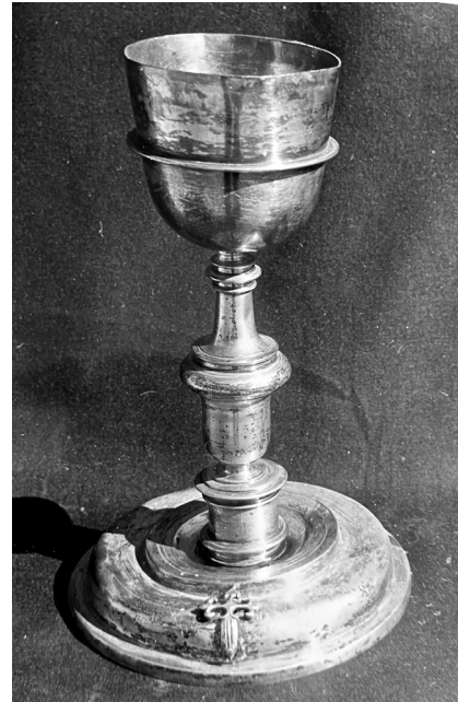
Fig.10. Cáliz de Losar de la Vera

Obra del maestro talaverano Juan Domínguez es un bien conservado y sencillo cáliz liso de comienzos del siglo XVIII (Fig. 10); es de plata en su color (23,8 x 8,7 x 15,1 cm) y mantiene bastantes características estilísticas de la centuria anterior. No obstante se observa una mayor esbeltez, aunque el astil es aún típicamente seiscientista. La peana es circular y se estructura en tres escalones: se adorna con molduras, con círculos concéntricos incisos y con una cruz en altorrelieve de Santiago, patrono de la parroquia de Losar de la Vera en la que se guarda este vaso. La copa es lisa y tan sólo exhibe un listel a su mitad.