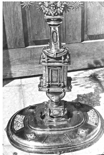
Fig. 8. Custodia de Cabezuela del Valle. Detalle

El sol es doble, incluyendo el viril, con rayos alternantes rectos y ondulados, rematados en estrellas los exteriores rectos. Apoya el mencionado sol en cuatro testas aladas de serafines —superpuestas dos a dos—, tiene veneras y enriquecen sus aros esmaltes —de la misma clase que los de la peana y astil— y vidrios coloreados. Remata el conjunto en una cruz, con los brazos de sección