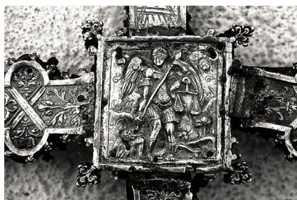
Fig. 4. Cruz procesional de Castañar de Ibor: San Miguel Arcángel