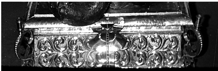
Fig. 11. Peana del Cristo de la Victoria de Serradilla. Detalle