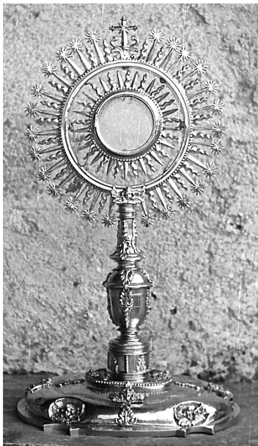
Fig. 12. Custodia de Serradilla