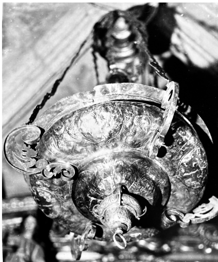
Fig. 9. Lámpara de Losar de la Vera

Pocos años después, en 1681, se fabricó en Talavera de la Reina una notable y bien conservada lámpara barroca (Fig. 9), que cuelga de la bóveda de la capilla del Cristo en el Sepulcro en la iglesia parroquial de Santiago Apóstol de Losar de la Vera (Diócesis de Plasencia). Es de plata en su color y el brasero mide 62,5 cm de diámetro. Se adorna dicho brasero con abundantes motivos vegetales y con carnosas ces , todo ello muy bien repujado y grabado a buril. Destacan las cuatro cartelas ovaladas que se distinguen en el brasero, en las que se representan, dos a dos, cruces de Santiago —símbolo parroquial— y sendos ángeles grabados e incensando en torno a un ostensorio radiado. El umbo exhibe ces laterales de fundición y caladas, y las cadenas, constituidas por bellos eslabones, arrancan también de tornapuntas de carácter vegetal. Parecida ornamentación manifiesta el copete superior.