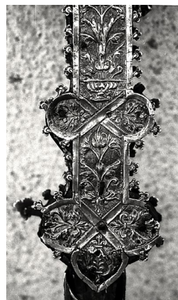
Fig. 5. Cruz procesional de Castañar de Ibor. Detalle

Un Juan de Ledesma Merino fue platero de la catedral de Sevilla los años 1600 y 1602 4 . En 1602 el notable platero Gaspar de Ledesma realizó un guión, un acetre y un hisopo para el colegio madrileño de doña María de Aragón 5 ; ignoramos la relación que pudieran tener estos dos plateros con el autor de la cruz y cáliz de Castañar de Ibor.