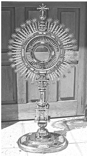
Fig. 7. Custodia de Cabezuela del Valle

de conservación es bueno (Figs. 7, 8), aunque le faltan dos placas de esmalte en la peana. Dicho pie, ovalado, se decora con esmaltes florales de colores blanco, rojo, azul, verde y negro, los dos extremos muestran el rosario y el central la inscripción “ABE MARÍA”: todos ellos tienen perfiles trapezoidales y romboideales alternantes y con lados curvos; falta una placa trapezoidal y otra romboideale por pérdida, como dijimos. Se embellece también la referida peana con finos grabados y arabescos realizados a buril sobre la gruesa chapa y tiene cuatro cogollos vegetales muy salientes en el borde. El astil es peculiar del clasicismo purista; se hermosea igualmente con esmaltes ovalados a los que se añaden gan-chillos barroquizantes y perillones a modo de pináculos: ostenta un bello tem-plete clasicista central con dos edículos rematados en frontones triangulares, uno de ellos con la figura de Cristo tratada a la grisalla. Se aprecia en el astil la misma clase de ornamentación ya citada, finamente grabada a buril.