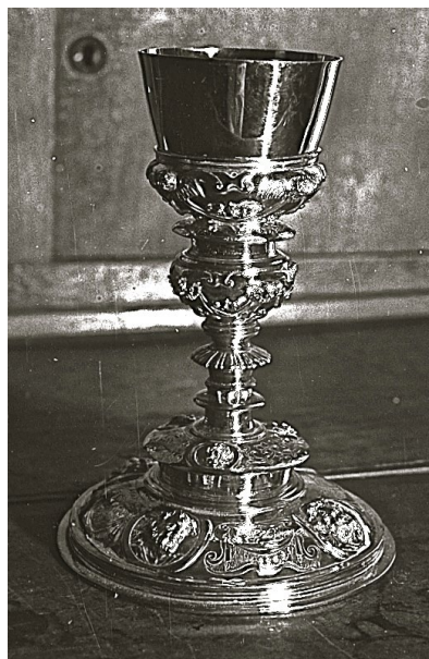
Fig. 6. Cáliz de Villar del Pedroso

sobredorada (22 x 15 x 8,5 cm). El pie, circular, se decora con prominentes y bellos relieves inscritos en tondos circulares, en los que se representa a los Evangelistas Marcos, Lucas, Mateo y Juan. En los espacios intermedios alternan testas aladas de angelitos, de las que cuelgan guirnaldas de tela, y cartelas manieristas de cueros vueltos, todo ello delicadamente grabado a buril. En la parte superior del arranque del astil se observan otras tres cabezas de apóstoles insertas en tondos similares a los del pie: San Pedro, San Pablo y un tercero con escuadra que ha de ser Santo Tomás. El astil, con abultada macolla esferoide, y la subcopa muestran serafines y guirnaldas de telas y frutas peculiares del manierismo avanzado. En el interior del pie se observan dos marcas iguales (una de ellas algo frustra) y la burilada de la extracción del metal necesario para el ensaye. La marca personal del platero, en monograma, se lee IV°VA/EZ (Fig. 1, B), y corresponde al artífice de Talavera de la Reina Juan Váez , citado en los documentos indistintamente como Váez o Báez, quien labró el cáliz de Villar del Pedroso en los años finales de la década de 1560. Algunas noticias documentales sobre Váez proporciona Margarita Pérez Grande, investigadora que afirma que no se conoce ninguna obra suya 6 . Por lo tanto, parece que este cáliz inédito de Villar del Pedroso es la primera pieza salida de su taller que se publica.