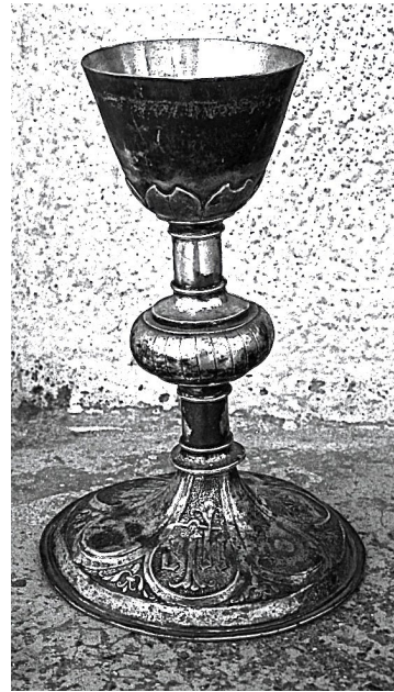
Fig. 2. Cáliz de Castañar de Ibor

Juan de Ledesma labró un cáliz de plata en su color de la parroquia de San Benito Abad de Castañar de Ibor 1 (22,5 x 8,8 x 14,5 cm). Por su estilo, aún muy gótico, se data en la década de 1530. El pie, circular y más avanzado, se decora con lóbulos goticistas que contienen los monogramas XPO, IHS (abreviaturas del nombre de Cristo) y, junto a detalles florales, varios símbolos pasionistas: escaleras, cruz, martillo y clavos. El astil, cilíndrico, es típicamente gótico, como también son góticas la macolla esferoide achatada, ornada con líneas verticales incisas, y la