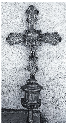
Fig. 3. Cruz procesional de Castañar de Ibor

más evolucionada, le faltan, por pérdida, las columnas exentas y la imaginería, quizá un apostolado, que se disponía en hornacinas aveneradas, con charnela abajo, flanqueadas por columnas en relieve de orden compuesto. Dicha macolla tiene estructura cilíndrica y adorna su bulbosa peana y la cúpula del remate con cinceladas cabezas de carnero, guirnaldas, frutos y fantásticos animales en forma de eses que ya apuntan al Manierismo. Sencillas líneas incisas en zigzag decoran el astil. Opinamos que esta excelente pieza inédita, carente de marcas, la fabricó Ledesma al final de su vida (la última referencia documental es de 1556) cuando ya habían calado en él los nuevos aires del Manierismo decorativo.