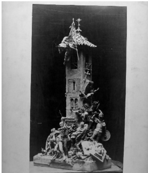
Fig. 1 Antonio Susillo, El grito de Independencia , 1884.

Entrada la segunda década del siglo XXI, apareció en el mercado artístico una colección de fotografías con la técnica de la albúmina propia de finales del siglo XIX con veinticuatro obras de Antonio Susillo. La mayoría están firmadas por detrás por el fotógrafo Eugenio Gómez 19 , establecido en la Calle San Juan de la Palma número 12 de Sevilla (Fig. 2).