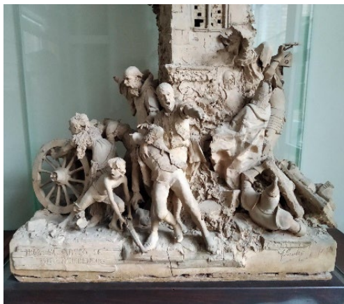
Fig. 4 Antonio Susillo, El grito de Independencia , 1884. Detalle. Colección Particular.

Los rasgos morfológicos muestran la gran cantidad de registros propios de Antonio Susillo. El análisis permite identificar cinco soluciones distintas que combinadas aumentan las posibilidades formales y expresivas aportadas por los distintos tipos de volúmenes y los contrastes de texturas. En primer lugar, tendríamos que hablar del modelado de bulto redondo de las principales figuras de los dos grupos, planteadas con movimientos decididos, con diagonales en el grupo de tierra y firmeza y verticalidad en el grupo sobrenatural. En esas figuras, el modelado es potente, muy plástico, en el primer caso con sugestivos contrastes entre la volumetría anatómica y los detalles de las ropas, muy representativo el que tiene lugar entre la espalda inclinada de una de las mujeres y el vestido que la descubre. Una segunda solución morfológica es la que refiere a esos detalles, trabajados con una gran soltura, cierto empaste y acabados pictóricos (Fig 4).