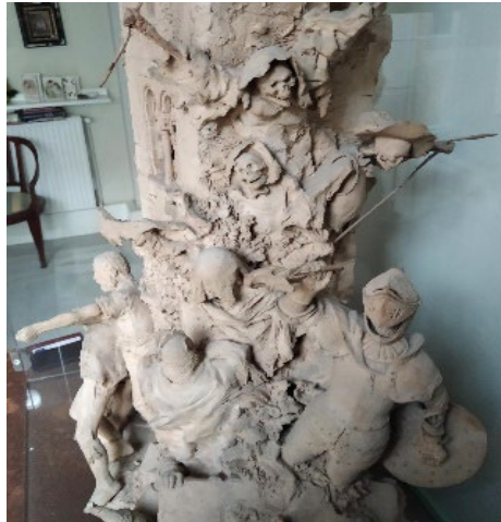
Fig. 6 Antonio Susillo, El grito de Independencia , 1884. Detalle. Colección Particular.

el escultor había seguido los versos del poeta Bernardo López García 21 . En los análisis antes efectuados, hemos podido comprobar que la descripción temática fue exacta, por lo que podemos confirmar el vínculo literario. Esa tendencia fue común a otros muchos artistas desde la época historicista en la que destacó el pintor sevillano Eduardo Cano 22 . Según José Cascales, Antonio Susillo lo hizo con un espíritu apasionado postromántico.