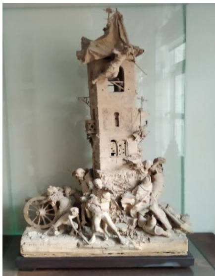
Fig. 3 Antonio Susillo, El grito de Independencia , 1884. Colección Particular.