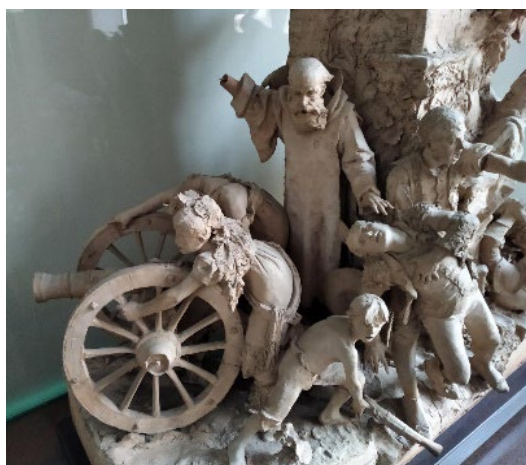
Fig. 5 Antonio Susillo, El grito de Independencia , 1884. Detalle. Colección Particular.

El equilibrio formal de Antonio Susillo consiste en la utilización de cada uno de esos procedimientos y las soluciones adecuadas de manera que señalan la articulación de las composiciones en distintas zonas y grupos. Aunque las escenas acumulan personajes y parecen abigarradas debido a la multiplicidad de los recursos, estos no se expanden indiscriminadamente, sino que el escultor los ubicó estratégicamente para señalar los límites espaciales y con esto los ámbitos de representación que corresponden a cada uno de los grupos (Fig. 5).