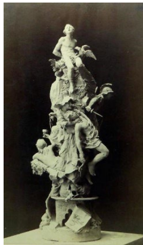
Fig. 8 Antonio Susillo, El grito de Independencia , 1884. Detalle. Colección Particular.

Fotografía: AIC. Antonio Susillo. La leyenda de Prometeo .