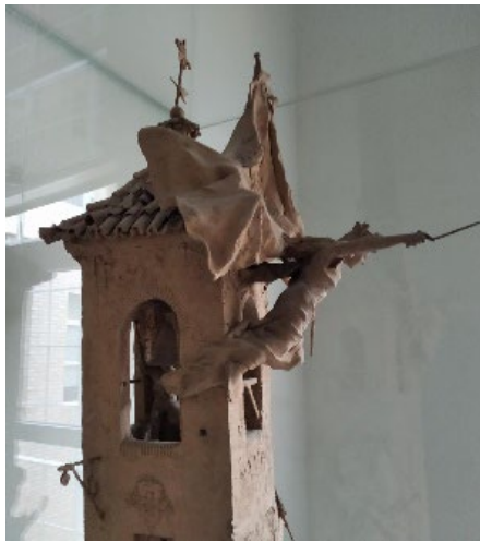
Fig. 7 Antonio Susillo, El grito de Independencia , 1884. Detalle. Colección Particular.

Los protagonistas del grupo de Antonio Susillo también aparecen en la pintura de Joaquín Sorolla Dos de mayo 31 , del año 1884. Nos referimos al soldado que cae desplomado sostenido por otro compañero, al joven que cruza en diagonal detrás de ese grupo con intención de manejar el cañón, la mujer que lo empuja y el militar que arenga a los soldados. Eso sí, la organización es muy distinta, aquí se trata de una sola escena de guerra, Sorolla no incluyó ningún grupo sobrenatural y narró con detalles el dramatismo de la batalla. La nitidez de los protagonistas en primer plano y la fuga velada de esa misma escena están concebidas de un modo muy distinto. El realismo es análogo, los recursos interpretativos no, pues Sorolla no tuvo ningún interés decorativista y resolvió los detalles con una objetividad distinta. Sólo el giro y el medio torso desnudo de uno de los soldados, muestra equivalencias con el de una de las jóvenes que