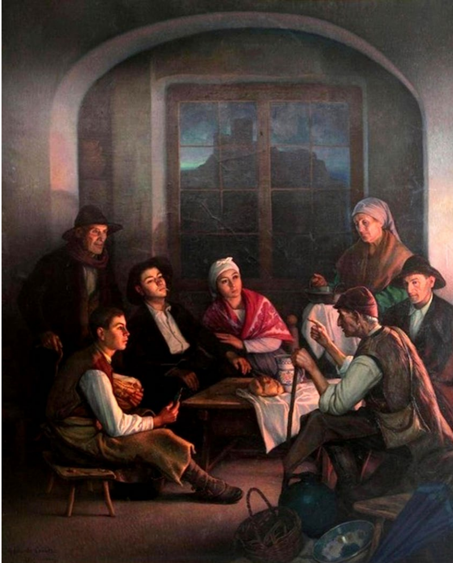
Figura 6: “La leyenda del Castillo”. Propiedad: Museo de Bellas Artes de Badajoz (MUBA). 33 .